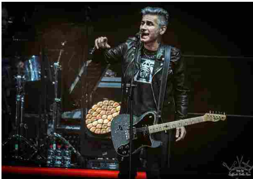
Un salto al cinema con il Baff, due passi in città e un po' di musica.