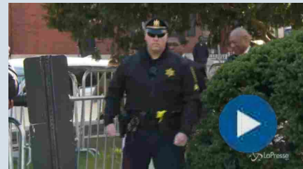
Molestie, Cosby e Polanski espulsi dall'Academy