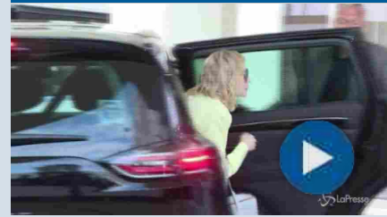
Cannes, l'arrivo di Cate Blanchett