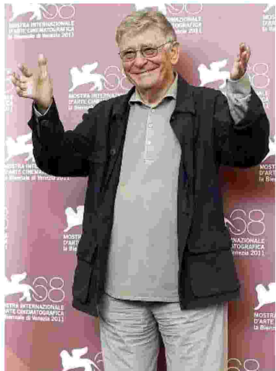
TRIBUTO Il Baff Film Festival si appresta a rendere omaggio al grande regista appena scomparso Ermanno Olmi